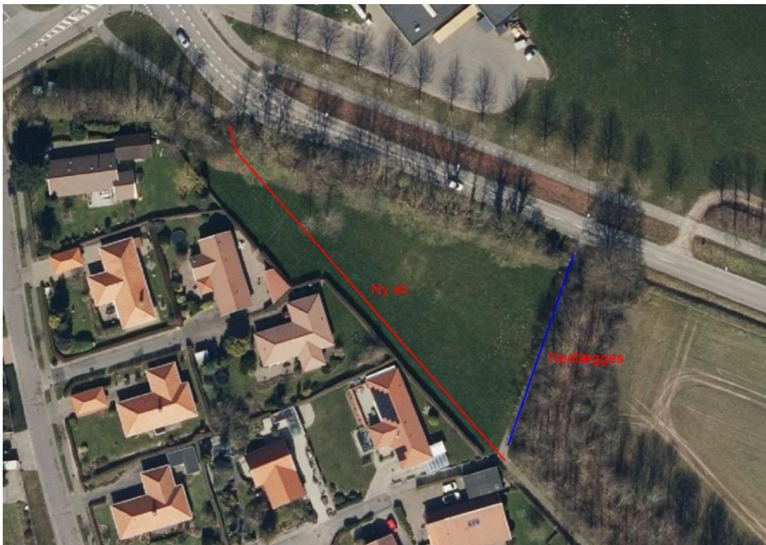
Figur 1 Vej og Parks forslag til sti-omlægning

Fredericia Kommune tilbyder at afholde alle omkostninger ved etableringen af løsningen!